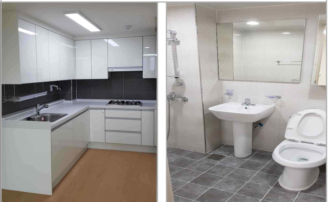
부엌 및 화장실